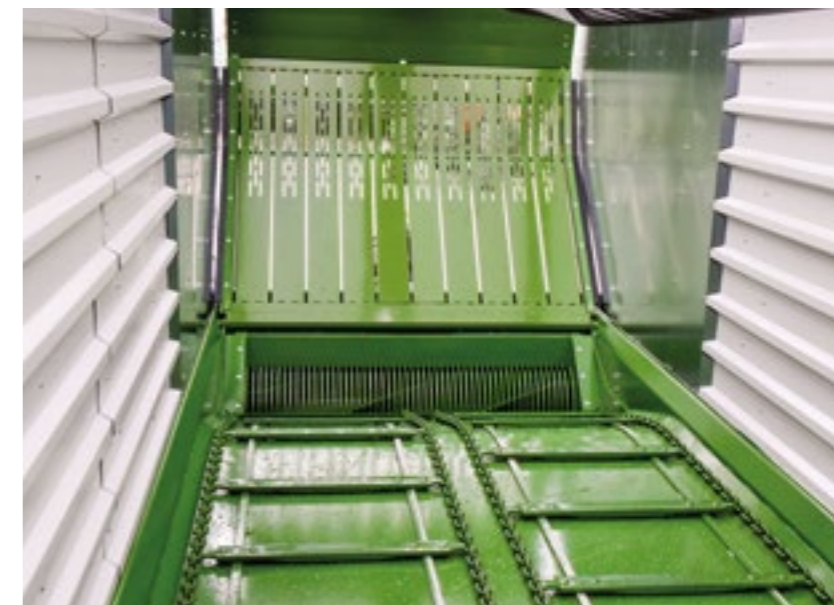
Kallistettu pohjakuljetin, 4 ketjua (14 x 50 mm, 25 tn/ketju)