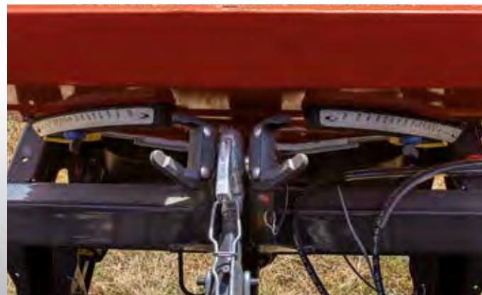
Selvästi näkyvät DfC-asteikot