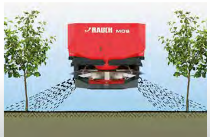
Rivilevityslaitteen RV 2M toimintatapa

Rivilevityslaitte RV 2M mahdollistaa kohdennetun ravinteiden annostelun riviviljelykasvien juuriston alueella. Ajouralle ei näin putoa rakeita. Tämä säästää arvokasta lannoitetta ja vähentää ympäristön kuormitusta. RV 2M on mahdollistaa säätää helposti ja portaattomasti 2–5 m riviväleille.