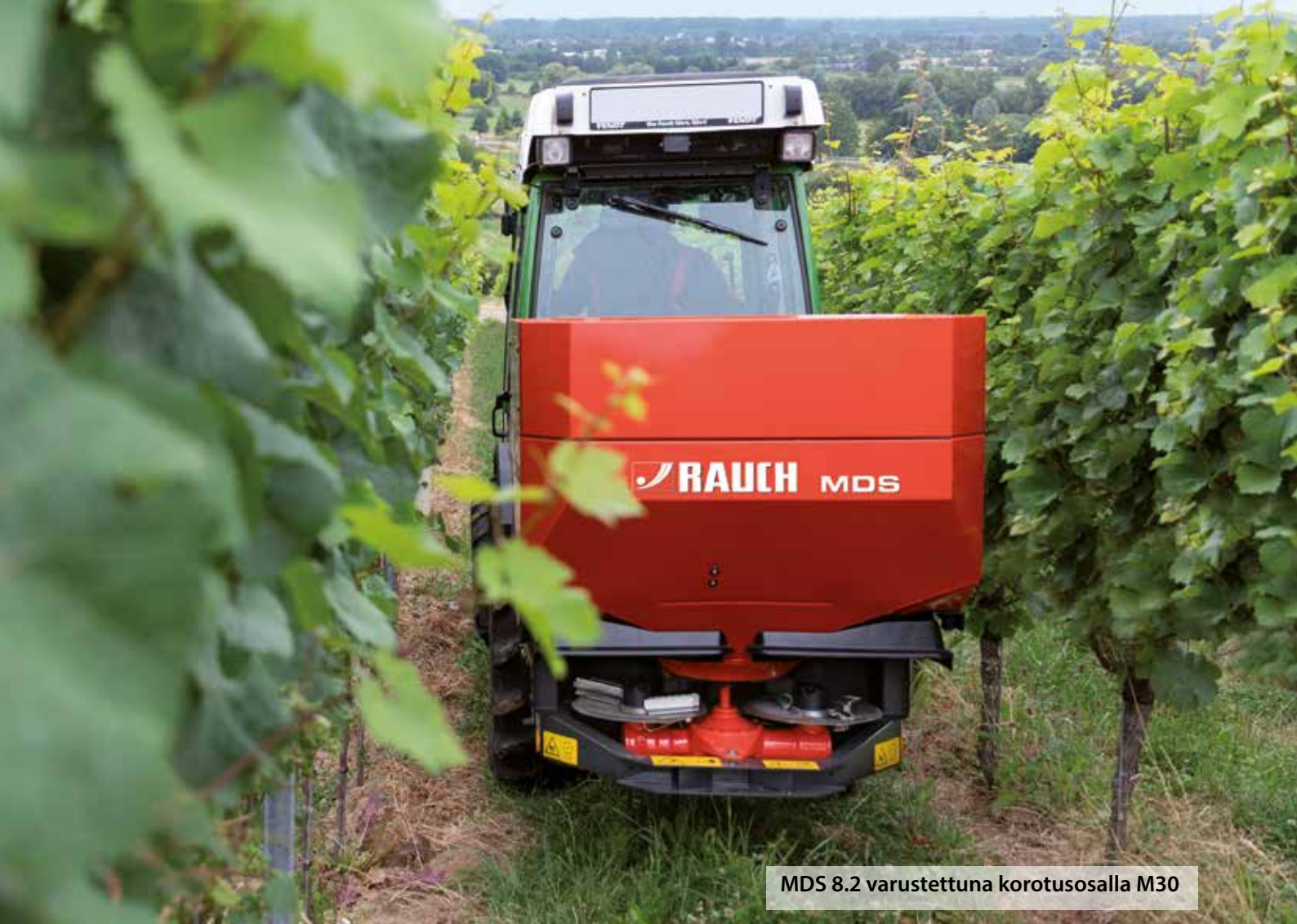
MDS 8.2 varustettuna korotusosalla M30

MDS-levittimet ovat korvaamaton työväline ammattimaiseen hedelmän-, viinin- ja humalanviljelyyn. Innovatiivisten yksityiskohtiensa ansiosta se soveltuu täydellisesti tähän tehtävään.