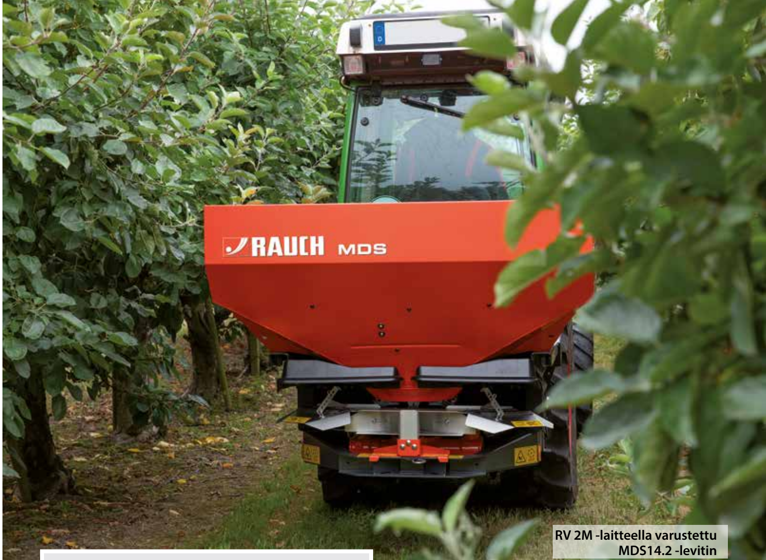
RV 2M -laitteella varustettu MDS14.2 -levitin