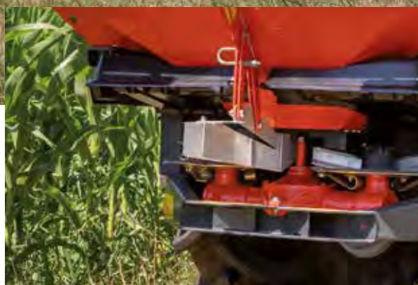
GSE 7, rajalevitys pellon rajalta