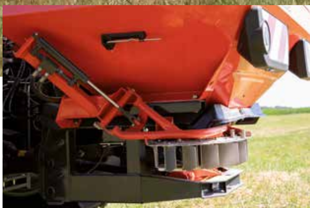
TELIMAT, rajalevitystä ajouralta käsin

GSE 7 on manuaalisesti ohjattava raja- ja reunalevityslaite, joka mahdollistaa yksipuolisen (vasemmalle tai oikealle) jyrkkäreunaiseen levitykseen suoraan pellon rajalta. Laite on mahdollista varustaa asiakkaan pyynnöstä kauko-ohjauksella. Laitteen voi yhdistää myös TELIMAT-järjestelmään.