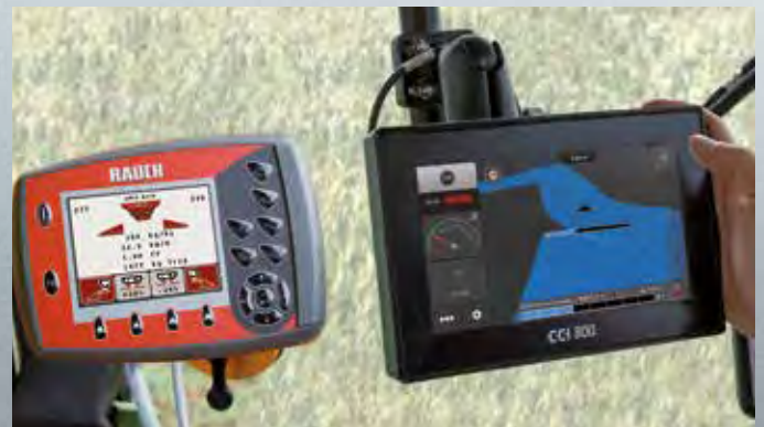
GPS-Control-toiminnolla varustettu QUANTRON-A

QUANTRON-A-järjestelmällä ja manuaalisella annostelupisteen säädöllä CDA varustetuissa MDS.2 -levittimissä on vakiovarusteena 8-portainen osaleveyskytkentä. Tämän VariSpread Pro -järjestelmän vaihtoehdon avulla on mahdollista säätää annosteluluistien asentojen kauko-ohjauksen avulla neljä osaleveyttä puolta kohti.