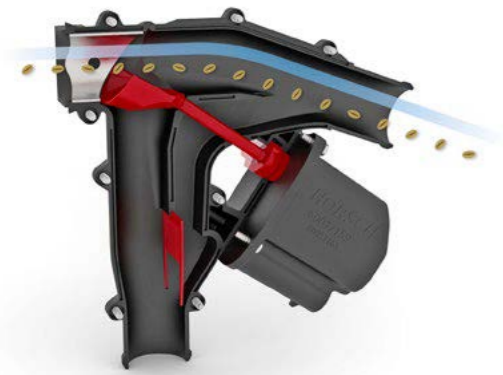
Läppä auki — Siemen ohjataan vantaalle