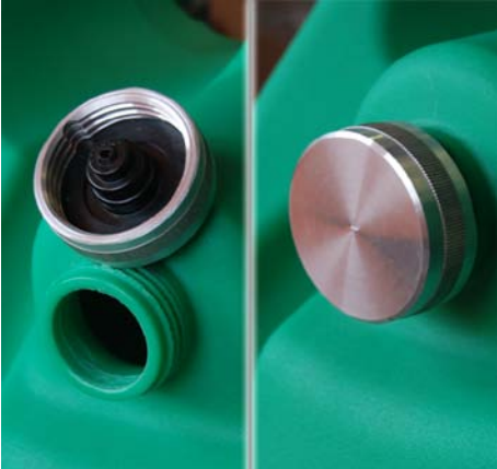
Läckfri påfyllningskork med luftventil