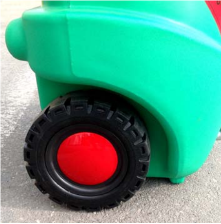
Stora hjul för lätt transport