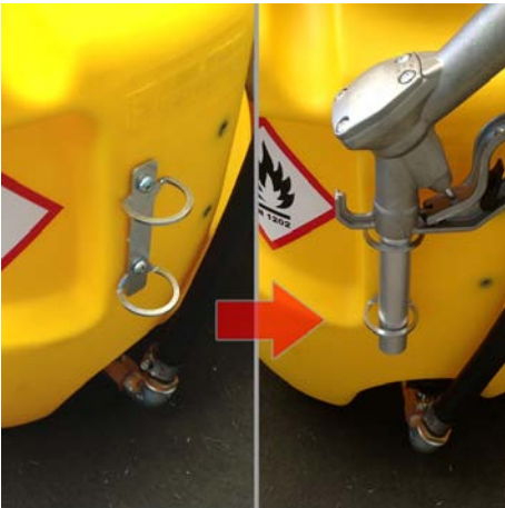
Hållare för tankpistol i behållarens övre del