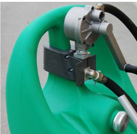
Hållare för pumpen