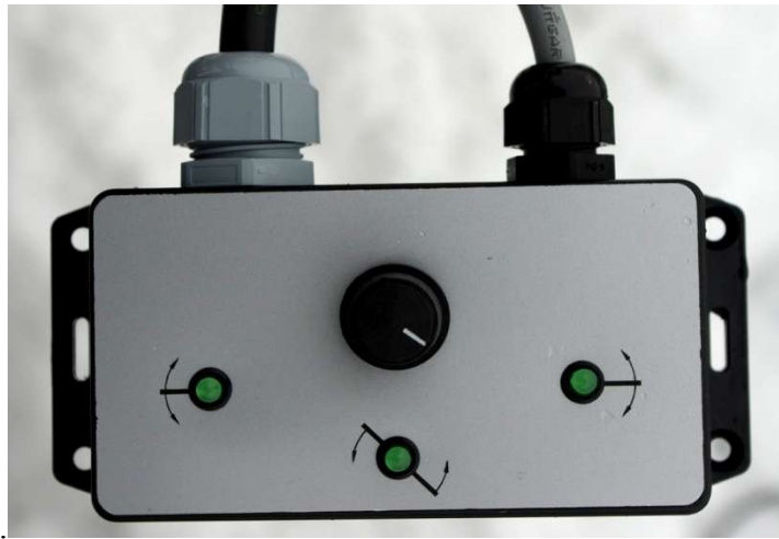
Piirros 2. Hydraulisylintereiden ohjauslaite.

Ohjauslaitteen vääntökytkintä vääntämällä valitaan, siirretäänkö vasenta tai oikeaa siipeä tai molempia samanaikaisesti.